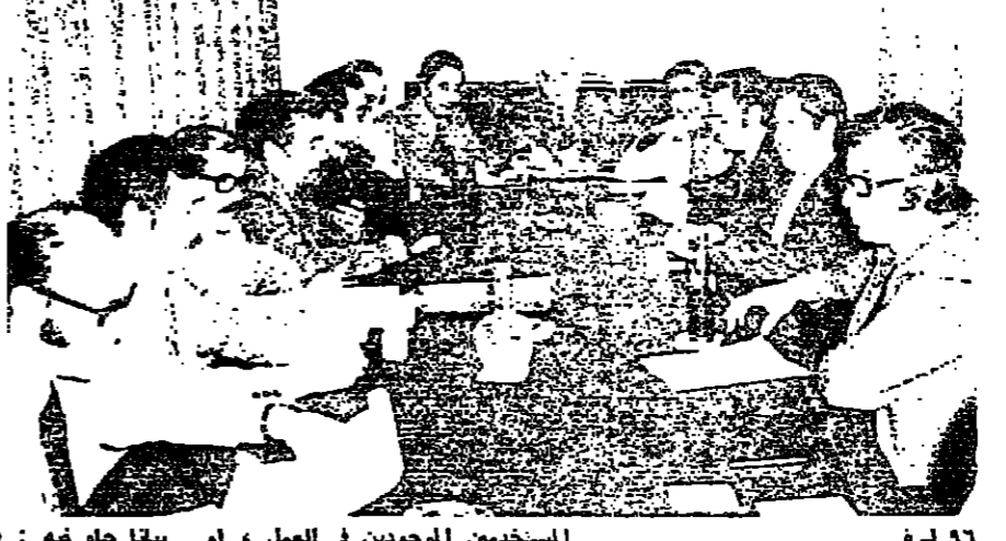
اتحاد موظفي المصارف خلال جلسته أمس

توصلت المفاوضات الجارية بين جمعية مصارف لبنان واتحاد نقابات الموظفين الى اتفاق من 5 بنود حول تعديل سلم الرتب والرواتب، والحد الأدنى، والطبابة والاجازات المرضية، ومنحة شهر.